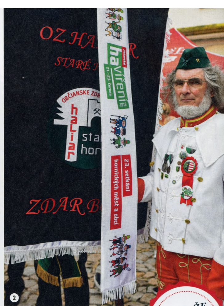
1/ a 2/ SETKÁNÍ HORNICKÝCH MĚST V roce 2019 hostila Jihlava v rámci Jihlavského havířeni také Setkání hornických měst. Hostitelským městem vždy prochází hornická paráda - zástupci jednotlivých havířských spolků s historickými prapory. 3/ ROKOKO Jednotlivá řemesla spojená s hornictvím konkrétní doby představují jihlavské děti.

VÍTE, ŽE Součástí hornického kroje je hůl, sekerka zvaná švancara.