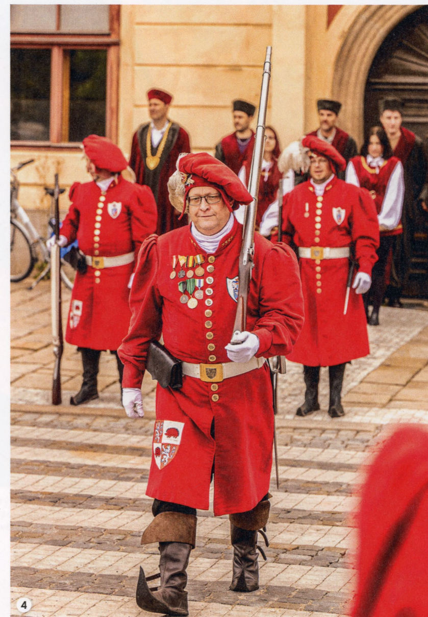
4/ JIHLAVŠTÍ OSTROSTŘELCI Jejich střílení z historických zbraní nesmí chybět nejen při průvodu, ale ani na žádném ze setkání hornických měst. 5/ TRUCBÁBY Podle pověsti prý měly dámy problém s nošením nepohodlných renesančních límců – okruží.