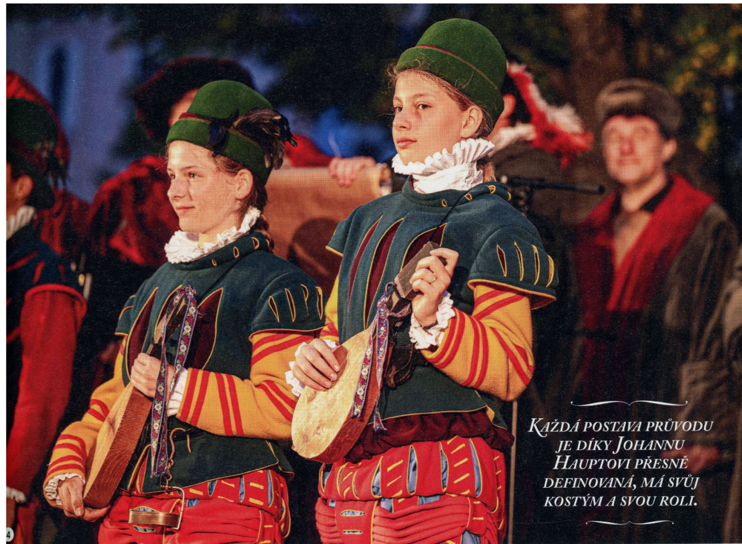
4/ HORNÍČTÍ PĚVCI Mají žluté punčochy, červené kalhoty s modrým podložním, španělské boty, kazajka je zelená a má žluté rukávy, klobouk zdobí kohoutí peří. Nesou si atrapy mandoliny. 5/ PERKMISTR Čestná postava, pro kterou byli vždy vybíráni ti nejschopnější hoši za odměnu. Perkmistr má zelený kabátek zapínaný vpředu stříbrnými knoflíky a na hlavě sametový baret.

Více informací: havirskypruvod.cz , bilinskekruseni.cz