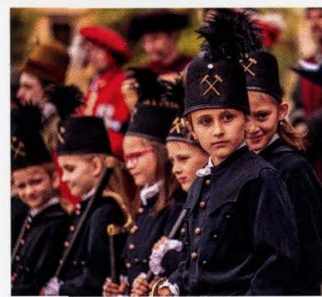
JIHLAVSKÉ HAVÍŘENÍ Pozvánka na unikátní slavnost