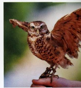
ZVÍŘÁTKA & PACIENT Návštěva záchrané stanice