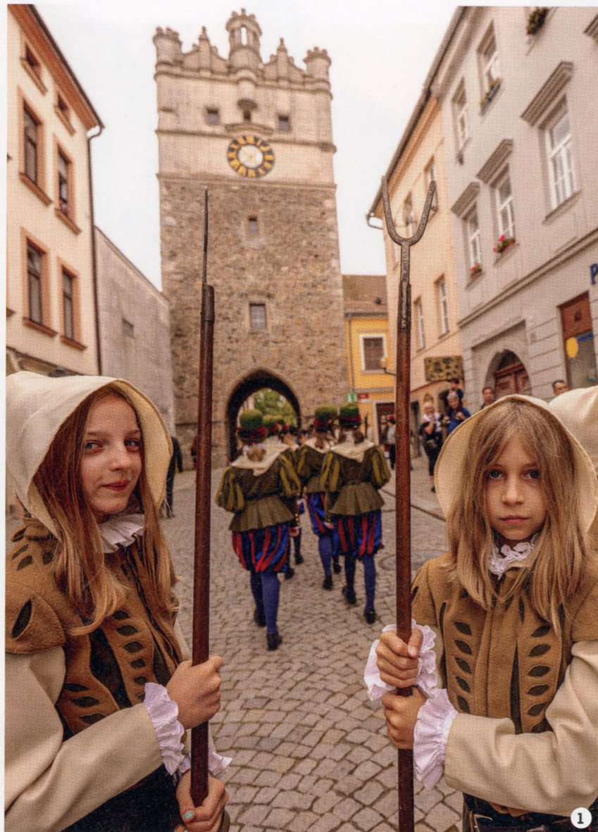
1/ HAVÍŘŠTÍ UČNI (PERMONÍCI) S VIDLICÍ Mají kabátek s kapucí, krátké žluté kalhoty a žluté podkolenky. 2/ KUTNIČKY Nejmenší v průvodu se vezou na vozíku.